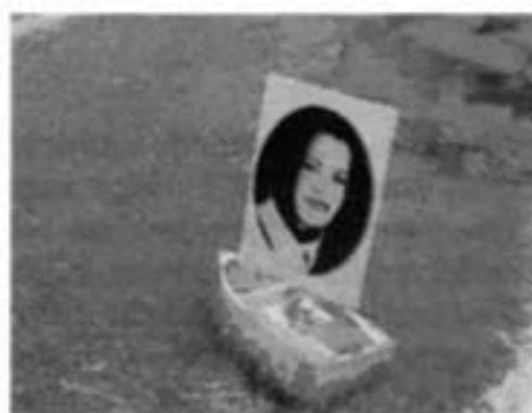
En seglats som slutade med konstskandal.